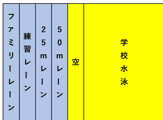
学校水泳時 4レーン空き